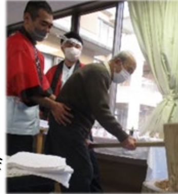
新年会でお餅つき大会